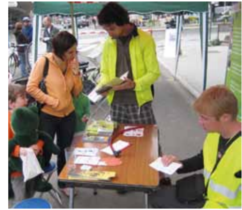
Semaine de la mobilité 2009, Stand du GRACO (Pinoy) Week van de vervoering 2009, stand van GRACO (Pinoy)

In Elsenne heeft zich dat geconcretiseerd in het project Durabl'XL/Bouillon Malibran. De bedoeling was een mobiel voorwerp te bedenken dat aan de inwoners de mogelijkheid zou bieden om te koken tijdens de wijkfeesten en kan worden gebruikt bij de Zinneke Parade. Een mooie uitdaging die werd voorgesteld aan twee architectuurateliers, die van