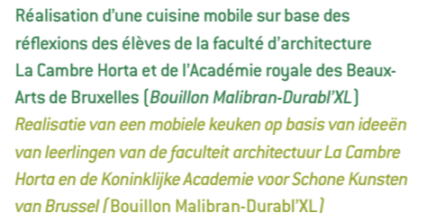
Réalisatie d'une cuisine mobile sur base des réflexions des élèves de la faculté d'architecture La Cambre Horta et de l'Académie royale des Beaux-Arts de Bruxelles (Bouillon Malibran-Durabl'XL) Realisatie van een mobiele keuken op basis van ideeën van leerlingen van de faculteit architectuur La Cambre Horta en de Koninklijke Academie voor Schone Kunsten van Brussel (Bouillon Malibran-Durabl'XL)

Er zijn nieuwe SAGALS geopend en enkele biomanden worden regelmatig geleverd: duurzame voe-